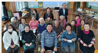
オキナワしあわせサークル